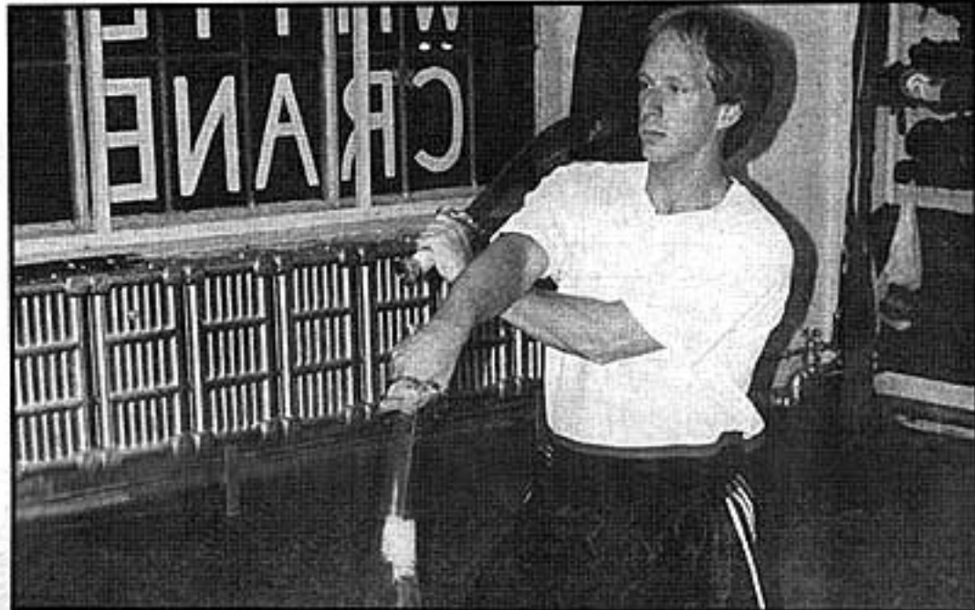
Les utilisateurs du double sabre cherchent à récupérer l'énergie de son mouvement. Sa course s'accélère dans une vrille continue pour créer une sorte de tourbillon d'acier extrêmement rapide et dangereux